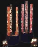
③兵庫県姫路市 「竹灯り」