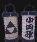
④神奈川県小田原市 「小田原ちようちん」