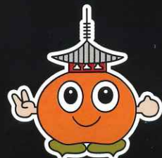
斑鳩町マスコットキャラクター 「パゴちゃん」

※新型コロナウイルス感染症や雨天の状況により、 内容変更等させていただく場合があります。