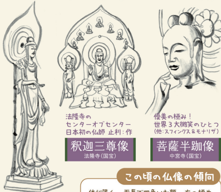
法隆寺の センターオブセンター 日本初の仏師 止利・作 釈迦三尊像 法隆寺(国宝)

スラッとしなやか8等身 優雅で静謐で360°聖 初☆国宝指定物の1つ! 日本の仏教美術代表!