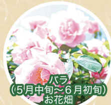
バラ (5月中旬~6月初旬) お花畑