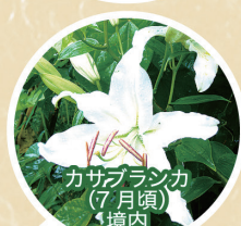
カサブランカ (7月頃) 境内