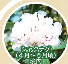
シヤクナゲ (4月~5月頃) 境内