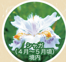
シヤガ (4月~5月頃) 境内