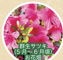
群生サツキ (5月~6月頃) お花畑